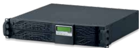
3 100 45