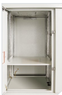
Телеком. отсек Отсек питания