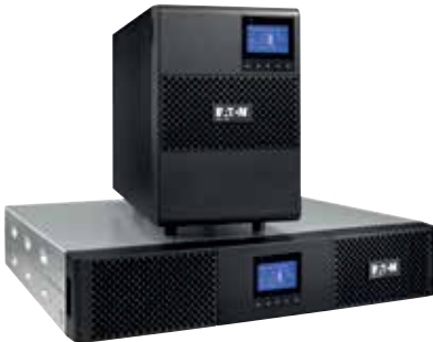
9SX модели стойка и башня